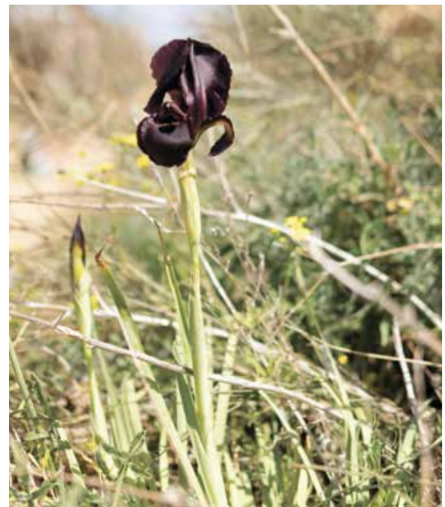
אירוס הארגמן בשמורה בנתניה. זוכים ליחסי ציבור טובים

"האיריסים ישרדו כי יש מס' פיק במקומות תחת שמירה. אלה אוכלוסיות שאפשר לתמוך בהן. הם זוכים ליחס ציבור טובים ולאחדה כי הם יפים, בולטים ופורחים תקופה קצרה. גם העובדה שהם אנדמיים לארץ ואפשר לראות אצלם תהליכי אבולוציה בעבודה מגינה עליהם. הם מרתקים גם מדעית וגם את שומרי הטבע". כדוגמה לבעיה ולתגלית מד' עית מסקרנת מציגה וולצ'ק מח' קר שעסק באיריסים בשמורה בנתניה, שם יש בעיה של האבקת הפרחים, כי הבנייה סוגרת על השטח מסביב. דבורים יחידאיות קטנות, בעיקר זכרים, מאביקות איריסים. מחקר שערך יובל ספיר גילה שלמעשה זה מקום לינה שלהם. הם נכנסים לפרחים לא כדי לחפש אבקה או צוף אלא כבית מחסה. הם שוהים בתוך הפרח כלילה וזה יתרון כי הפרח כהה והוא מתחמם מהר ויכולים לצאת לפעילות מוקדם בבוקר. אם לא צריך לדאוג לאיריסים, למי כן כדאי לדאוג? "אני דואגת לצמחים שגדלים