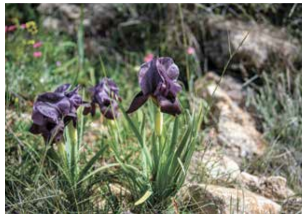
מלמעלה ובשער: איריס נצרת בגבעת המורה, למטה: איריס הגלבו ליד מלכישוע. כמעט כל סוגי האיריסים מוגנים בחוק

הגדולה ביותר". האם ישראל היא מעצמת איריסים? "מול טורקיה והקווקז אנחנו עניים. אבל הכי טוב לנסוע לאיראן. זו ממלכת האיריסים".